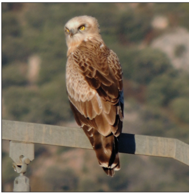
Autor - P. Manzano