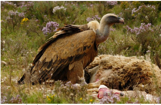
Autor - Eduardo Viñuales