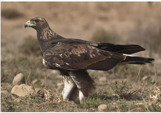
Autor - Fernando Tallada