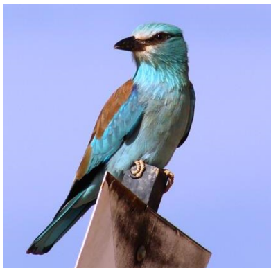
Autor - Roberto del Val