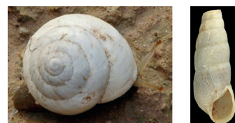
Caracol de la estepa

¡Ten mucho cuidado están vivos! Estos caracoles son blancos para poder sobrevivir en este ambiente donde les da mucho el sol. Ya sabes que si llevas una camiseta blanca en verano pasarás menos calor que si la llevas de color negro, pues eso mismo hacen estos caracoles.